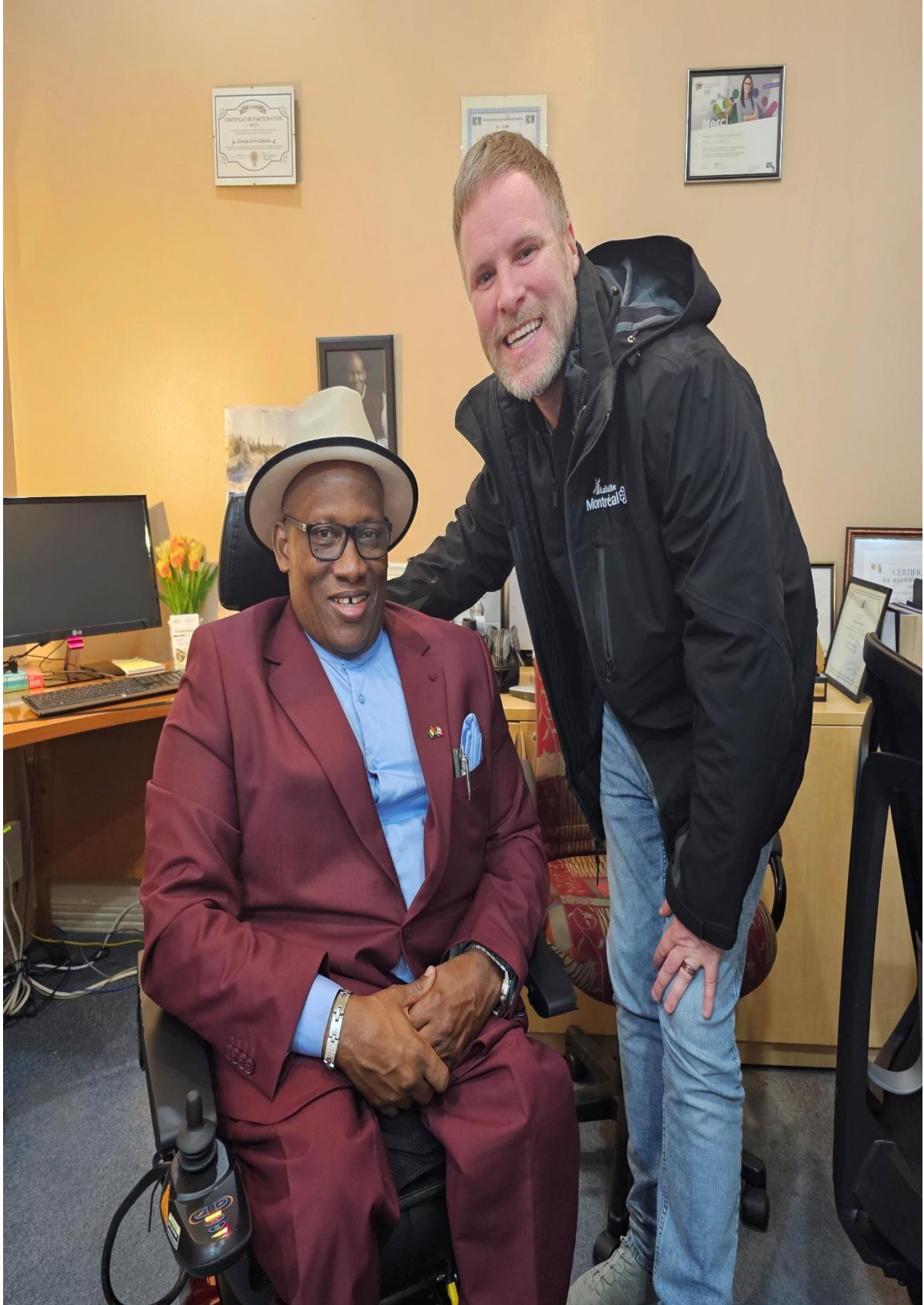
Rapport d'activités Handicap Action Intégration 2025-2026