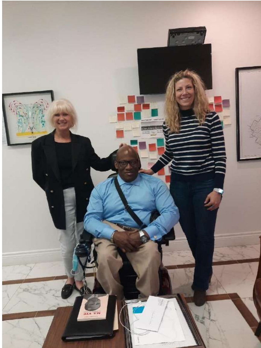
Assemblée générale annuelle de Handicap Action Intégration 2021-2022